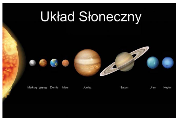
Mama Wczoraj Zapytała Mnie Jak Ułożone Są Nasze planety.